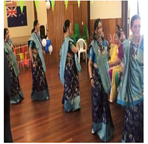
સભ્ય ભાઈબહેનોએ ઊત્સાહભરે ગરબા ગાયા. આરતી કરી સૌએ મહાપ્રસાદ ગ્રહણ કર્યો.