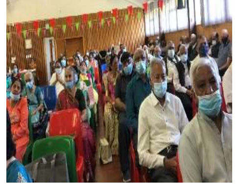
કોવિડ પ્રોટોકોલનું પાલન - જાન્યુઆરી ૨૦૨૨ વર્ષની પહેલી મિટિંગ.