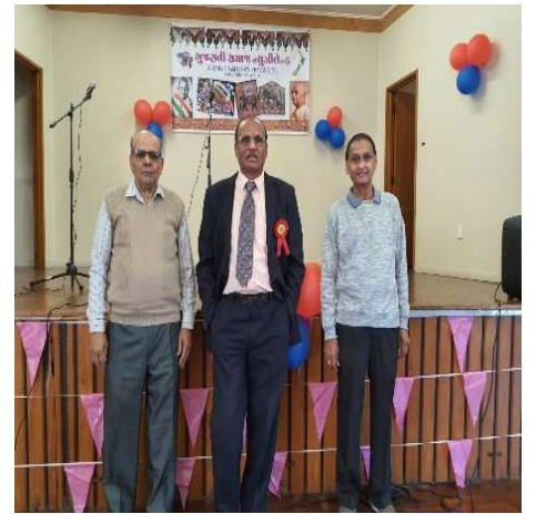
હોલ સજાવટ કરતા કમિટી મેમ્બર્સ તથા વોલેન્ટર્સ