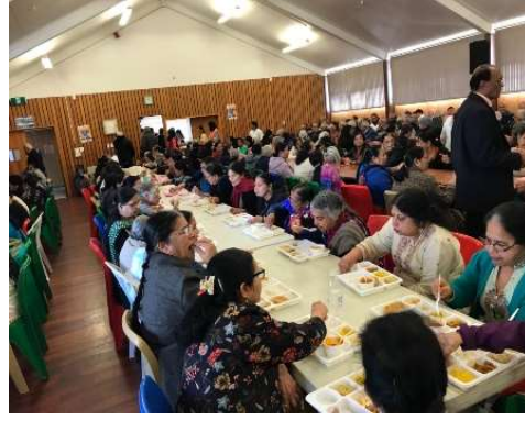
ભોજનનો રસાસ્વાદ માણતા સભ્ય ભાઈબહેનો.