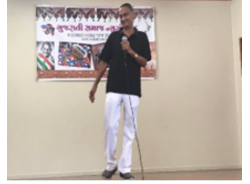
સભા ને સંબોધન કરતા કમિટી સભ્યો