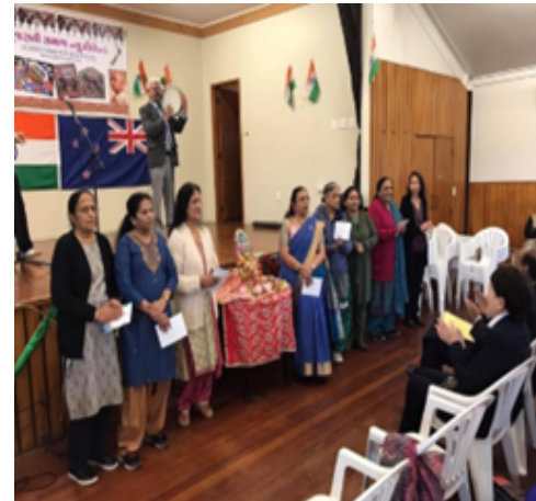
સભ્યો ના જન્મદિવસ ની ઉજવણી