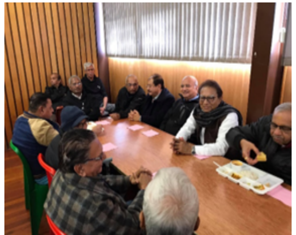
पिकनिक तथा भोजन नो आणंद मायता सभ्यो